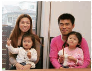
紗智ママファミリー Sati Mama Family

豪パパと4歳9カ月のこまちちゃん、 1歳9カ月のあすはちゃんの4人家族。 サーフィン大好きな父と、ジェ ルネイルにはまっているママのうでは プロ級!!