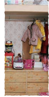
子供部屋のクローゼット

豪パパと4歳9カ月のこまちちゃん、 1歳9カ月のあすはちゃんの4人家族。 サーフィン大好きな父と、ジェ ルネイルにはまっているママのうでは プロ級!!