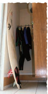
シューズクローク