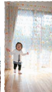
光いっぱいの子供部屋

Interview 沢山の壁紙を 使っていますね? そうですね、けっこう冒険して ました!わたしは迷ってしまうので、 パパがほとんど決めたのですが、子供 部屋は大きくなって大丈夫なように クローゼットの中だけ落ち着いた感じ のディズニープリンセスにしてみま した。子どもたちも大喜びでよかったです!