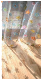
こまちちゃんのお気に入り