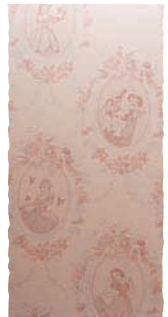
ディズニーの壁紙

Interview お家づくりの テーマは? 「やっぱり湘南の家」です。 休日は家族そろってウッドデッキで バーベキュー。 家の中は、狭くても開放感があり、 落ち着く家。あと、人の集まる家かな。