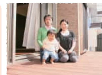
家族で日なたぼっこが楽しみになりました

お子さまの成長を安心して見守れる明るいお家ができました。楽しい思い出がたくさん作ってください。