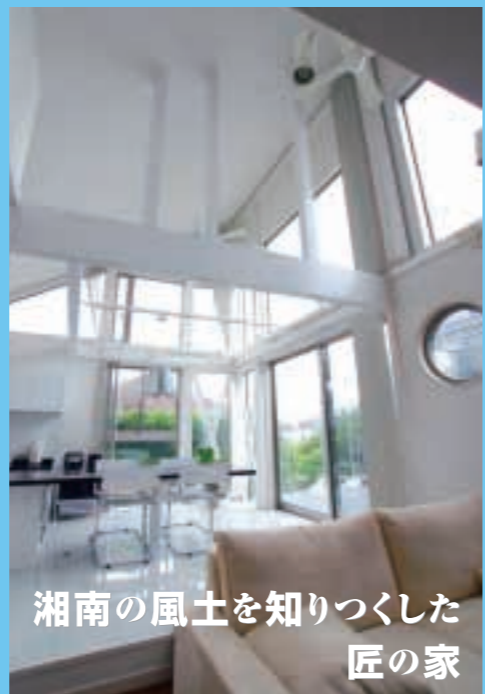
湘南の風土を知りつくした 匠の家